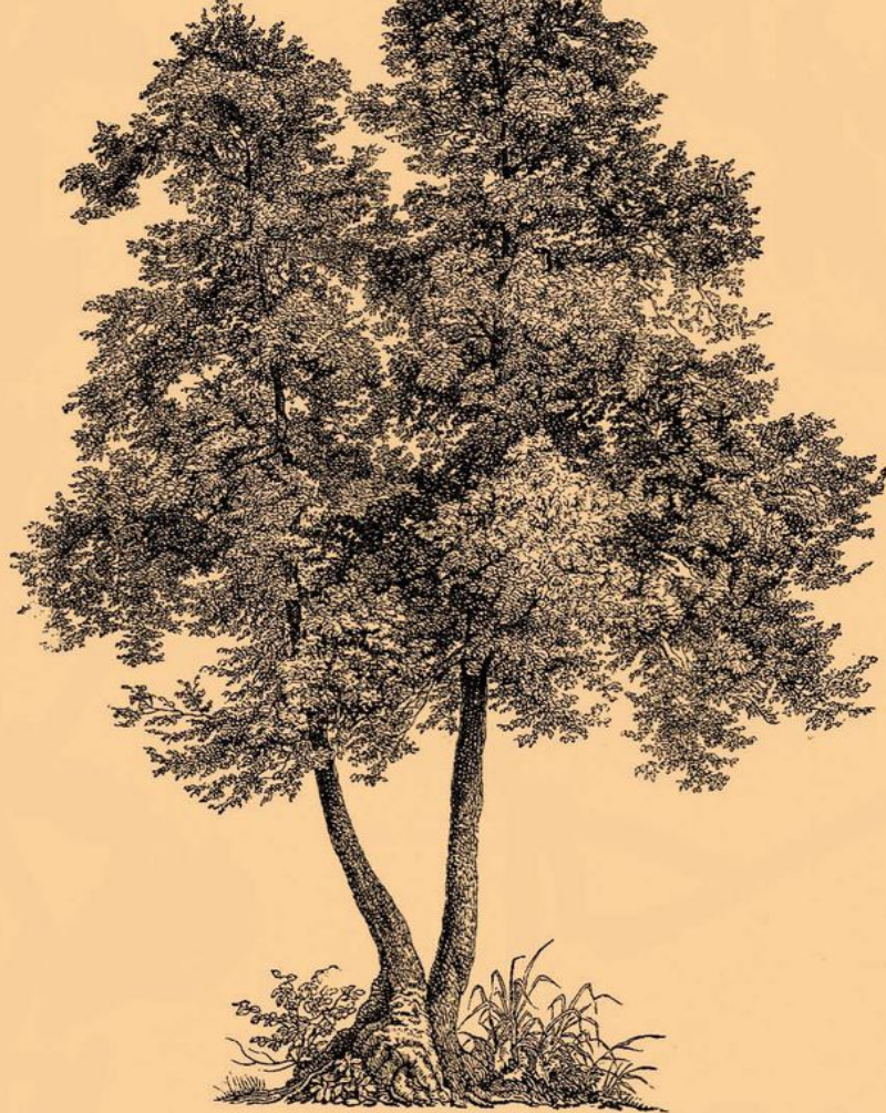
1. Ольха черная ( Alnus glutinosa ).