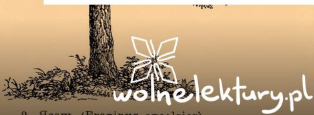
2 Ясень ( Fraxinus excelsior ).